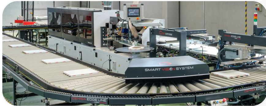
SMART VISION SYSTEM