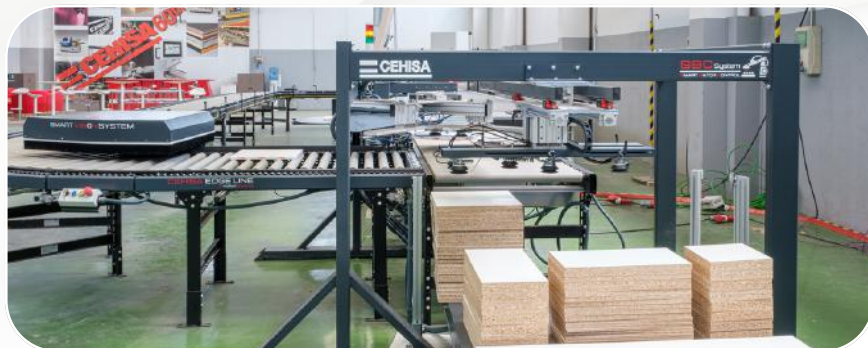
AUTOMATIC LOADING AND UNLOADING

CEHISA EDGE LINE ofrece un proceso de canteado 100% automatizado.